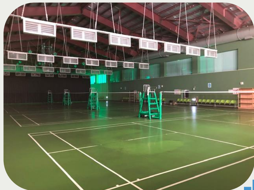
羽球場 排球場 籃球場