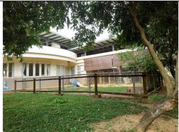
狗狗散放草地外觀